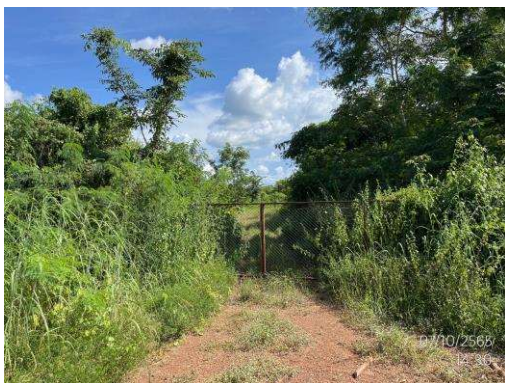
รูปที่ 1-4 สภาพของพื้นที่ฐาน WBNE-B ในระยะพักหลุม (Shut in)