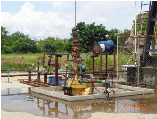
รูปที่ 1-2 สภาพของพื้นที่ฐาน WBNE-C ในระยะผลิตปิโตรเลียม