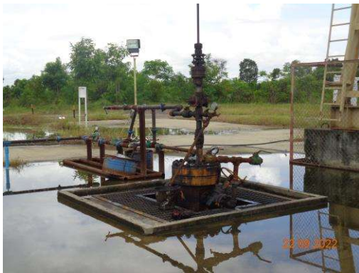
รูปที่ 1-3 สภาพของพื้นที่ฐาน WBNE-A ในระยะผลิตปิโตรเลียม